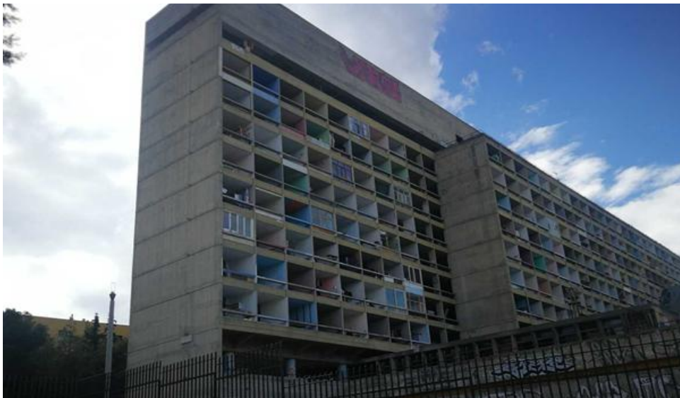
Εικόνα 2: Υφιστάμενη άποψη της Παλαιάς Φοιτητικής Εστίας στην Πολυτεχνειούπολη Ζωγράφου

Συνολικά το κτήριο πάσχει από οικοδομικές φθορές οι οποίες οφείλονται σε υγρασία, κακή συντήρηση αλλά και παλαιότητα. Επιπλέον, η λειτουργία κοινόχρηστων χώρων υγιεινής δημιουργεί ιδιαίτερες ανάγκες επίβλεψης της λειτουργίας τους, μεγάλο κόστος συντήρησης και άλλους υγειονομικούς κινδύνους. Ακόμη, οι Η/Μ εγκαταστάσεις λόγω παλαιότητας, έχουν εκτεταμένες φθορές και δεν είναι δυνατόν να προσαρμοστούν στις σημερινές απαιτήσεις.